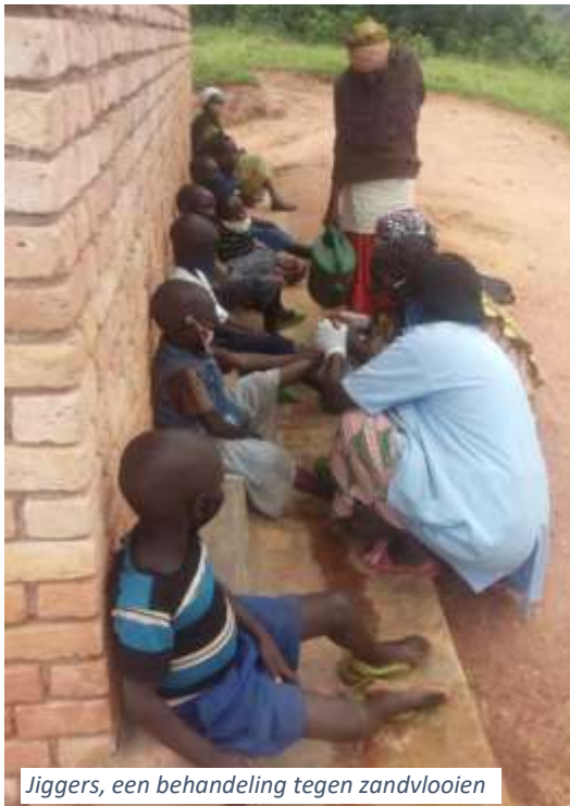
Jiggers, een behandeling tegen zandvlooien

De opbrengst van de markt gaat naar een hygiënekit voor de kinderen van dit pygmeëënvolk welke de gezondheidstoestand ten goede zal komen. Zo'n pakket bestaat uit zeep, tandenborstel, tandpasta, desinfectiemiddel en een handdoek.