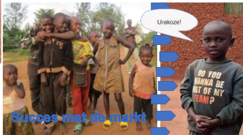
Succes met de markt