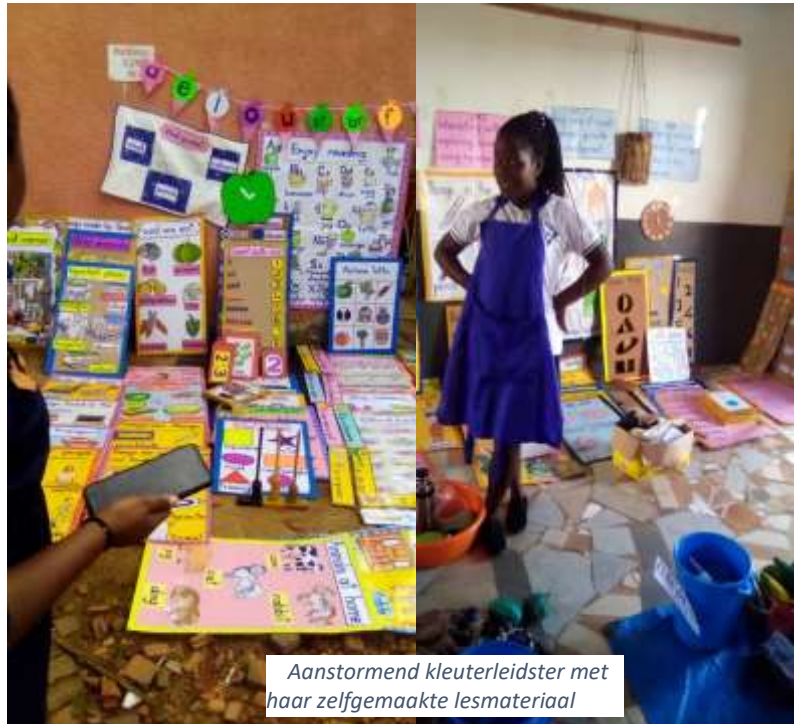
Aanstormend kleuterleidster met haar zelfgemaakte lesmateriaal

In samenspraak met het ministerie van onderwijs gaan zij hier beginnen om ook jongens op te leiden in technische vakken. Er lopen veel jongens op straat te niksken nu scholen nog gesloten zijn. Maar de focus blijft op de meiden. Wij wensen ze succes met deze nieuwe ontwikkelingen.